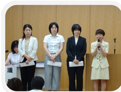
新役員のあいさつ